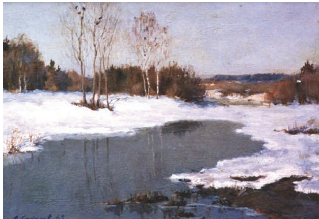
«Весна» 1965 х/м 50x75

Такое же динамичное карнавальное настроение, подчеркнутая театральность, красочность палитры отличают его «Поездку к морю». Длинное белое платье дамы в центре картины намекает на романтическую историю в стиле Лермонтова. Цветовая гамма и поэтич-