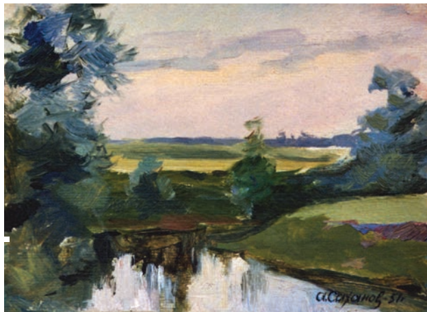
«Водоемы» 1951 карт. м 30x40