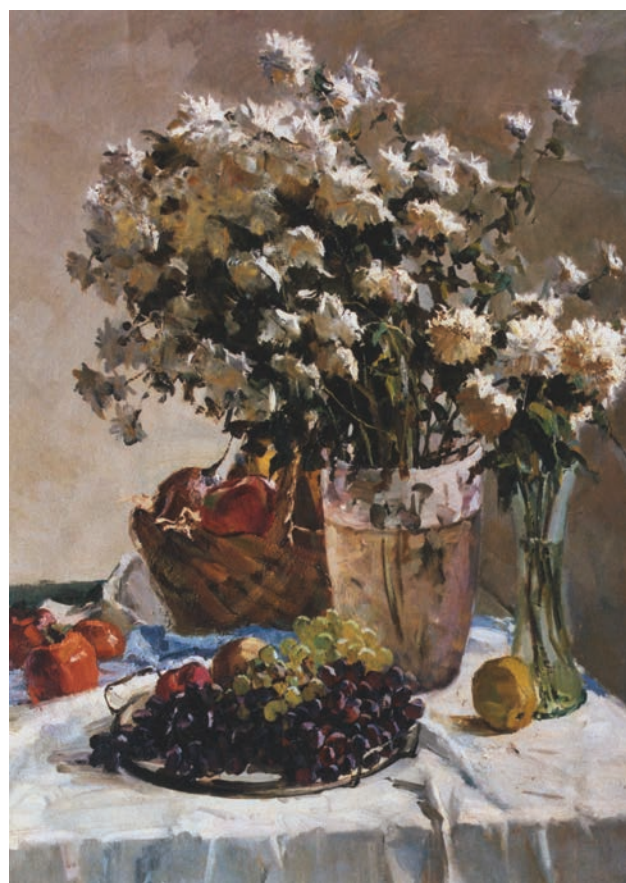
«Натюрморт с цветами» 1967 х/м 110x80