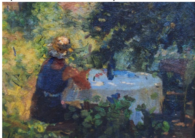
«Летом в саду» 1940 х/м 25х35

Высокое мастерство украинских этюдов и лирические пейзажи России открыли московской обще-