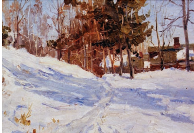
«Деревья Горки» (Зимка) 1970 х/м 30х50