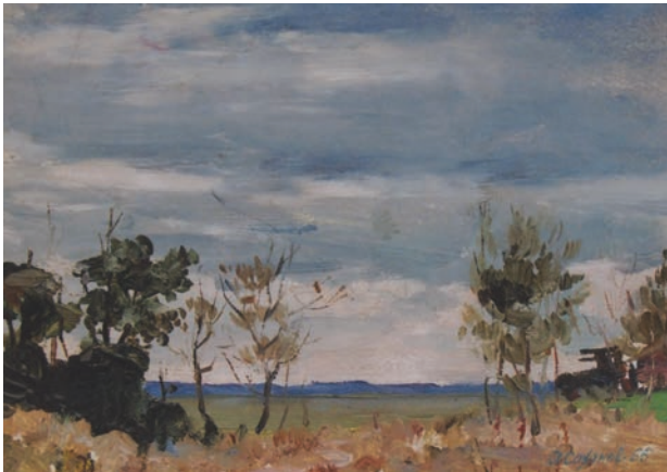
«К вечеру» 1955 к/м 25x40