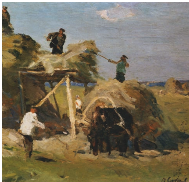
«Уборка сена» 1959 карт. м 40x40