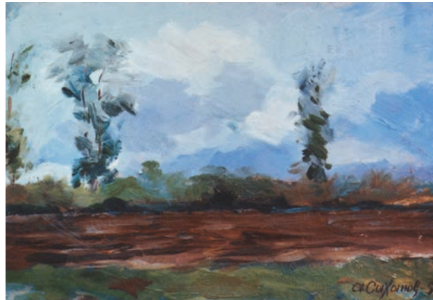
«Осенняя дорога» 1959 х/м 25х35