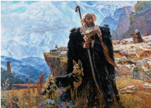
«Горец» 1980 х/м 150x200

Как истинный романтик, А.И. Саханов всегда старался угадать будущее. Узнав о строительстве московских высоток, он нашел на выставке макет гостиницы «Ленинградская» и вписал его, соблюдая масштаб, в