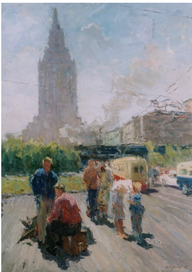
«Каланчевка» (Три вокзала) 1948 х/м 120х90