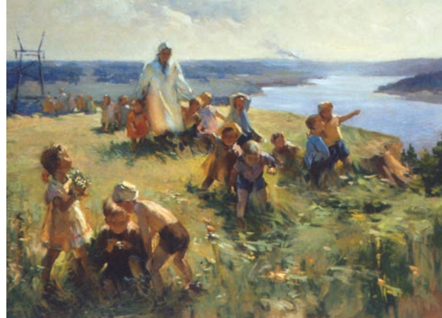
«Детский сад» 1952 х/м 90x130