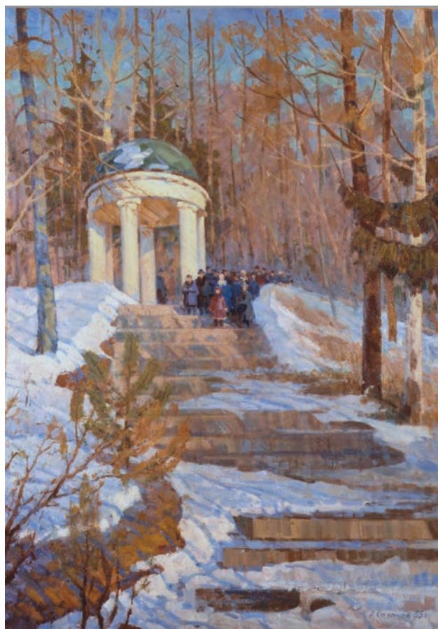
«Прогулка по Горкам» 1985 х/м 120х110