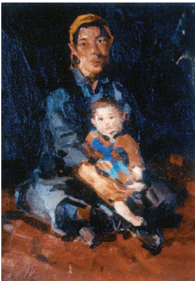
«Тувиночка» 1959 х/м 52х45