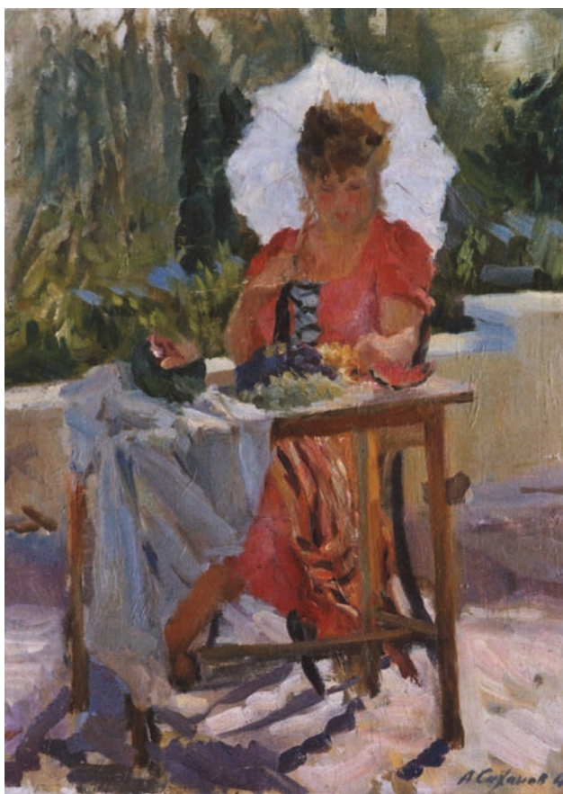
«Девушка с белым зонтиком» 1940 х/м 55x40