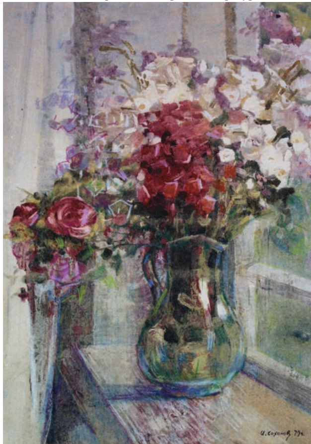
«Натюрморт» 1979 х/м 65x50