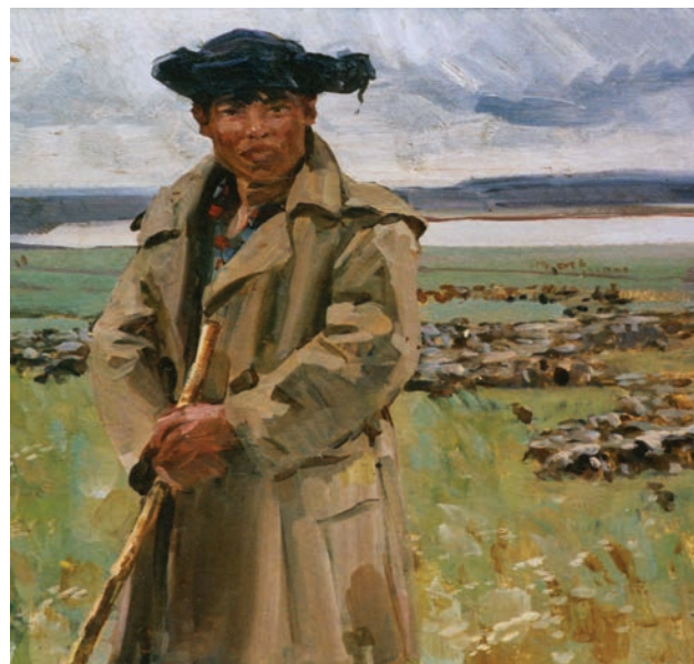
«Лето в Бурятии» 1965 карт. м 40x60