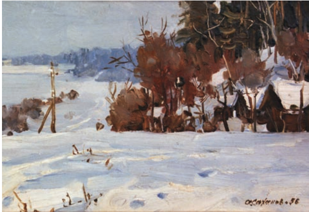
«Зимний пейзаж» 1956 х/м 45х70