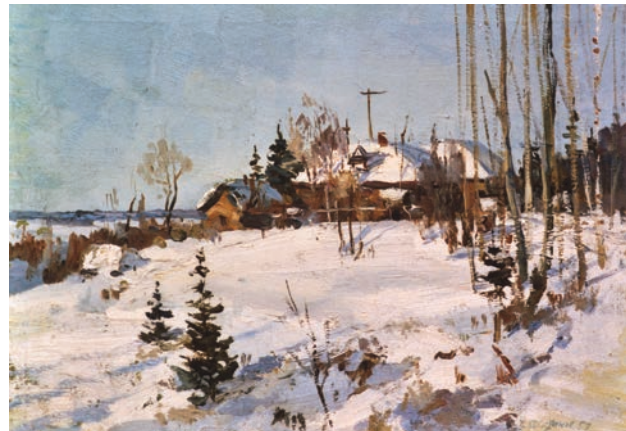
«Зимнее утро» 1957 х/м 50x60