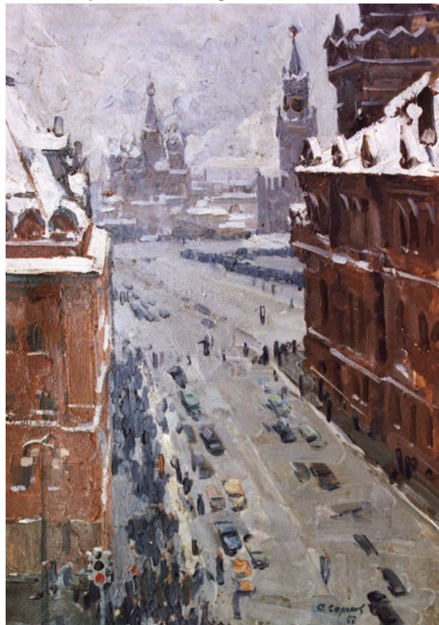
«Красная площадь» 1957 х/м 170x100