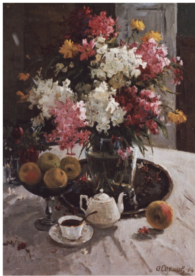
«Цветы с фруктами» 1964 х/м 87х66